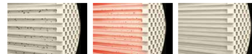
1. Partikel gesammelt