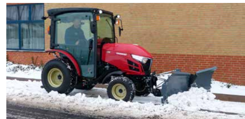
Eine umfangreiche Auswahl an Aufsatzgeräten machen diese Traktoren zu wahren „Allroundern“

Für eine intuitive Bedienung sind die Hebel praktisch und ergonomisch an beiden Seiten des Fahrers angebracht.