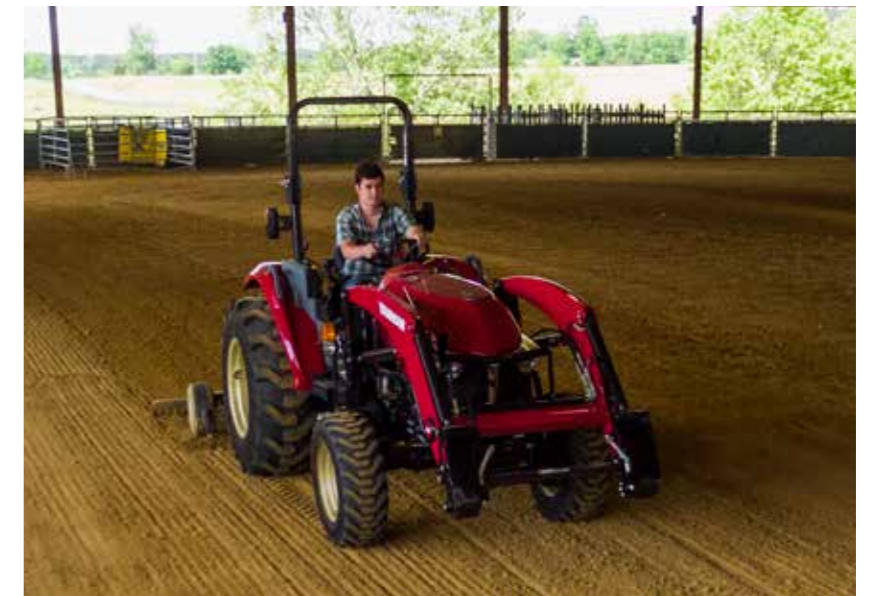
YT2-Traktoren vereinen eine Vielzahl funktionaler Eigenschaften und Merkmale – ein wahres Vergnügen für Eigentümer und Fahrer

Eine Höchstgeschwindigkeit von 31 km/h ermöglicht einen schnellen Ortswechsel zwischen den einzelnen Arbeitsstätten dank der Straßen- und Geländegängigkeit auf PKW-Niveau.