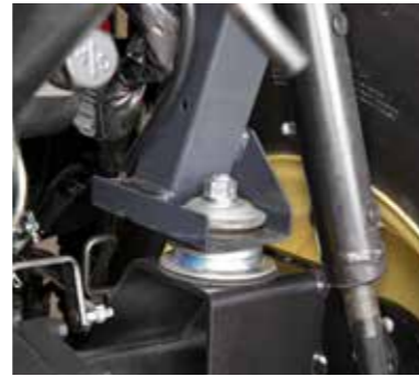
Werkseitig installiert für Präzision

Ein speziell entwickeltes System aus schwingungsfreien Karosserieauflagen aus Gummi überträgt kaum noch Geräusche und Schwingungen auf den Fahrerbereich, so dass ein komfortables Arbeiten ohne die üblichen Ermüdungserscheinungen auch während einer mehrstündigen Arbeit möglich ist.