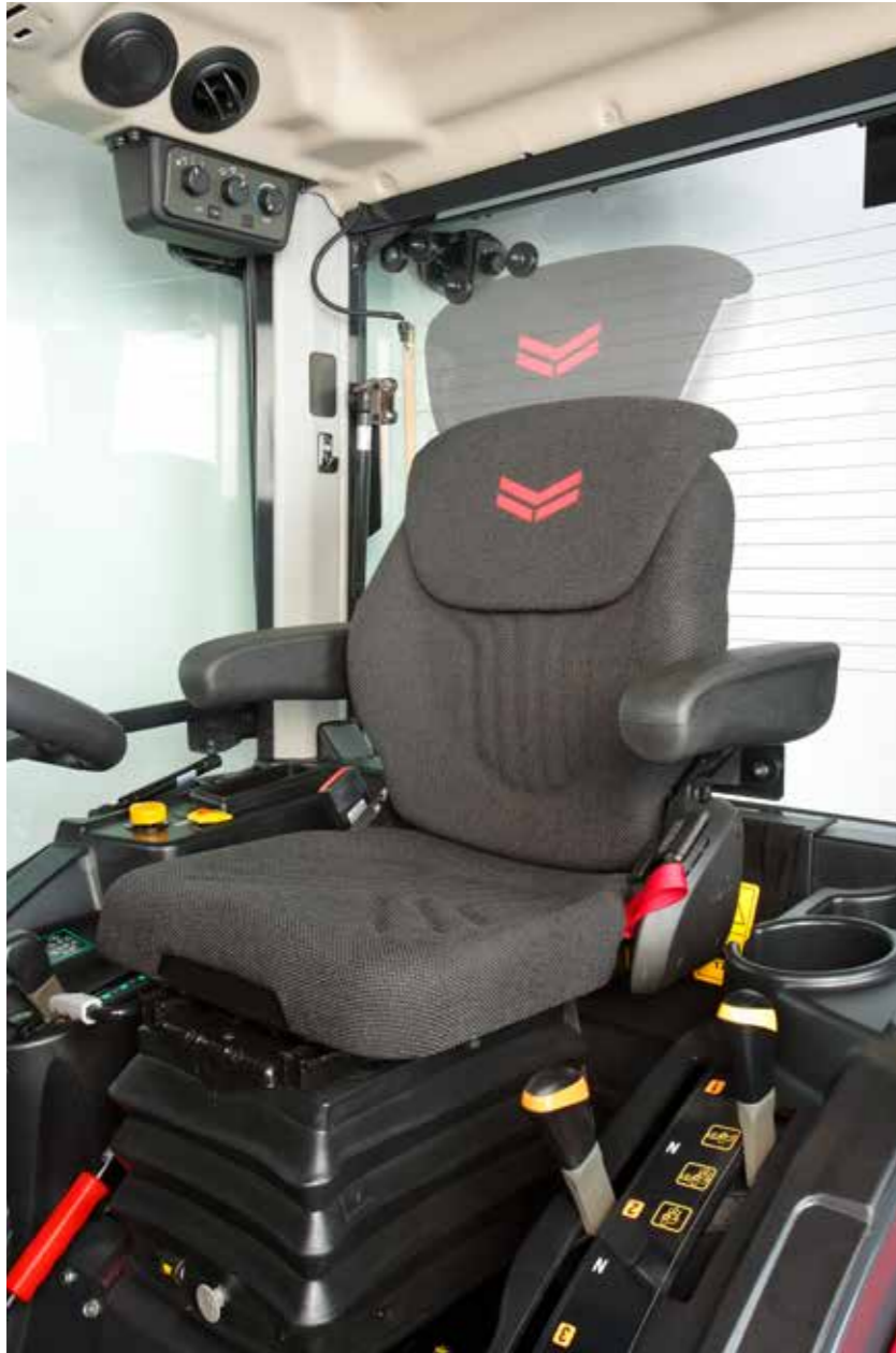
Luxussitz für optimalen Komfort