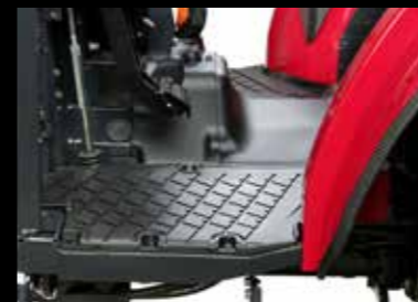
Ein ebener Boden sorgt für viel Beinfreiheit