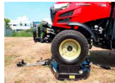
Zwischenachsmähwerk mit Überfahrfunktion

Der völlig neu entwickelte Yanmar-Frontlader kann ganz einfach montiert bzw. demontiert werden und bietet ein Höchstmaß an Hubkapazität. Der Lader wurde zusammen mit dem Traktor entworfen, so dass beide perfekt zusammenpassen.