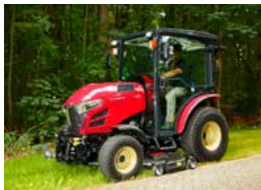
Die Präzision des mittigen Mähwerks