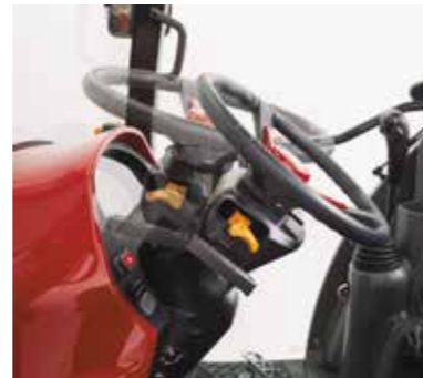
Verstellbares Lenkrad für eine perfekte Anpassung an den Fahrer

Durch das verstellbare Lenkrad kann der Fahrer die Maschine passend auf seine Körpergröße, -haltung und sein Komfortempfinden einrichten.